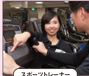
スポーツトレーナー