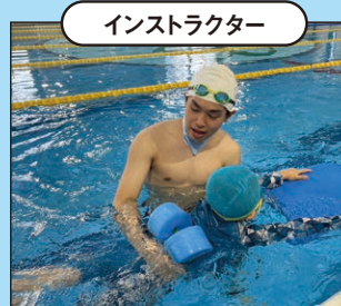
インストラクター