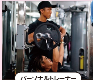
パーソナルトレーナー